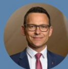
Thomi Jourdan Regierungsrat